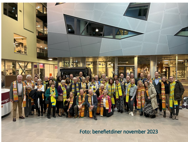
Foto: benefietdiner november 2023

De opbrengst van het benefietdiner "The table of Gift" is ruim € 7.000,-. Wij kijken terug op een kleurrijke, gezellige en succesvolle avond waarin we elkaar hebben ontmoet en heerlijk hebben gegeten. Een avond welke in 2024 voor herhaling vatbaar is. Dank aan allen die deze avond mede mogelijk hebben gemaakt!