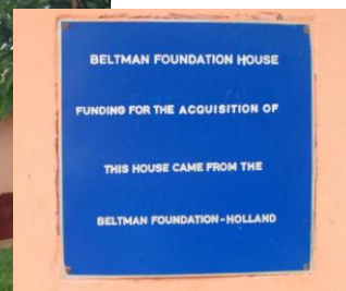
Stichting Ondersteuning Wenchi Hospital wordt steevast 'The Beltman Foundation' genoemd.