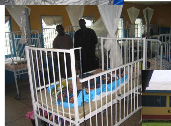
Het ziekenhuis beschikt over een goed ingerichte kinderafdeling. De patientjes kunnen goed verzorgd worden en voor de staf is het prettig werken.