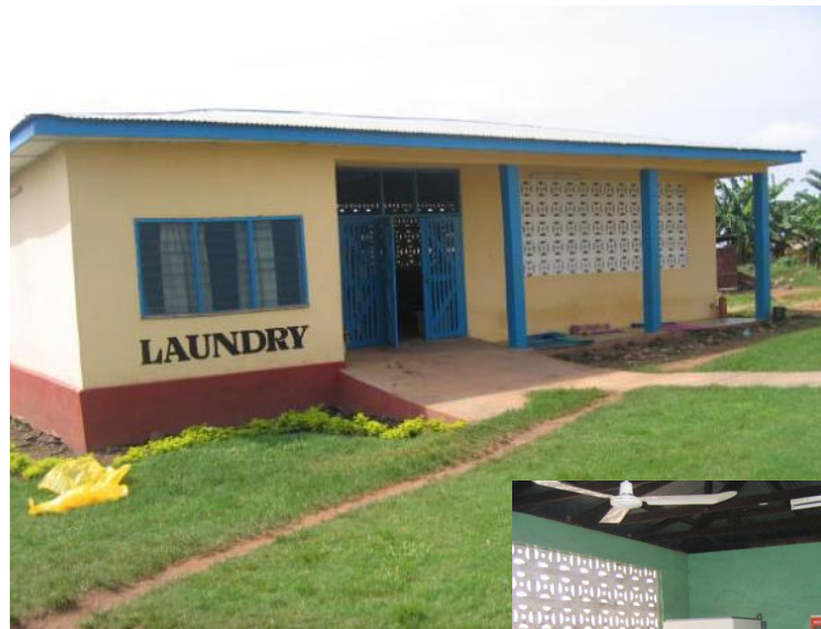
De in 1998 met hulp van St Wenchi Hospital gebouwde wasserij (één van de eerste projecten) staat er keurig onderhouden bij. Volop in gebruik en een onmisbaar onderdeel van het ziekenhuis